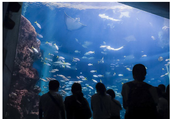
夜は体色に変化する魚も