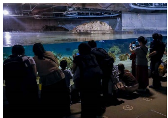
昼と夜では魚の数が？