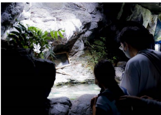
夜も灯る照明の秘密